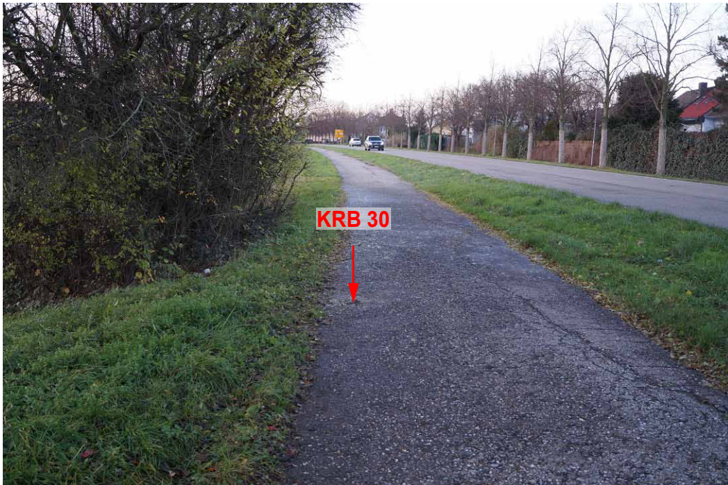
Bild 26: Lage von KRB 30 (Blickrichtung NW) (29.11.2017)