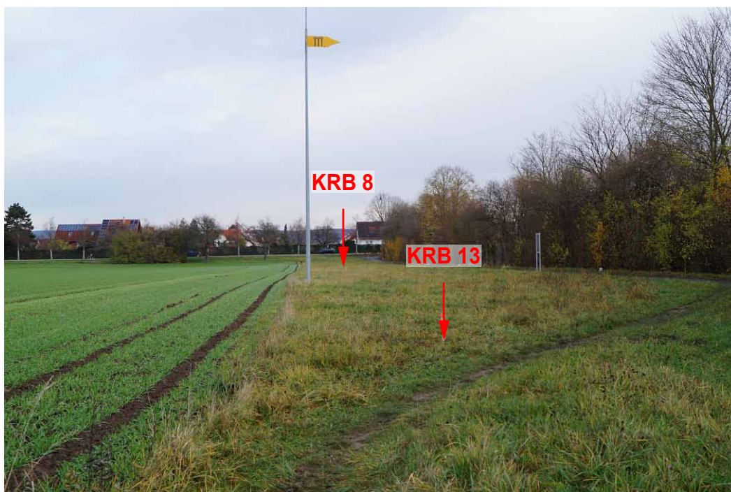
Bild 8: Lage von KRB 8 und KRB 13 (Blickrichtung NO) (23.11.2017)