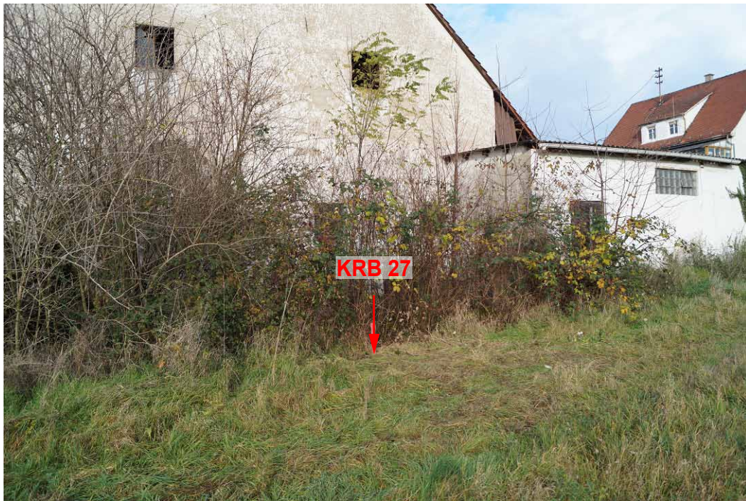
Bild 23: Lage von KRB 27 (Blickrichtung N) (23.11.2017)