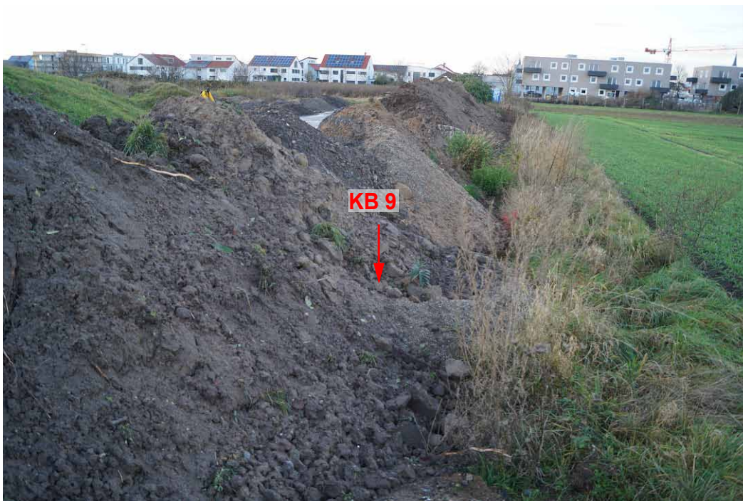
Bild 35: Lage von KB 9 (Blickrichtung NW) (29.11.2017)