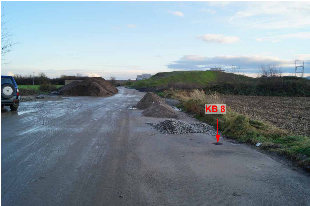
Bild 34: Lage von KB 8 (Blickrichtung SO) (29.11.2017)