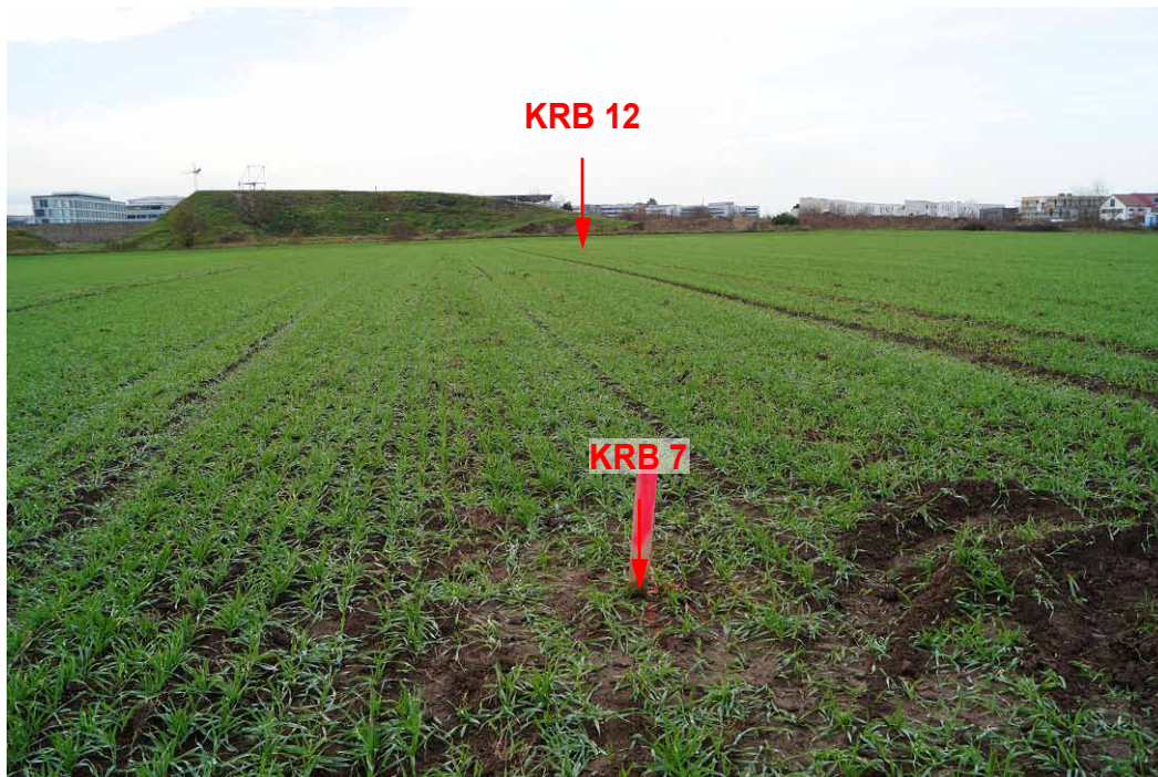
Bild 7: Lage von KRB 7 und KRB 12 (Blickrichtung SW) (23.11.2017)