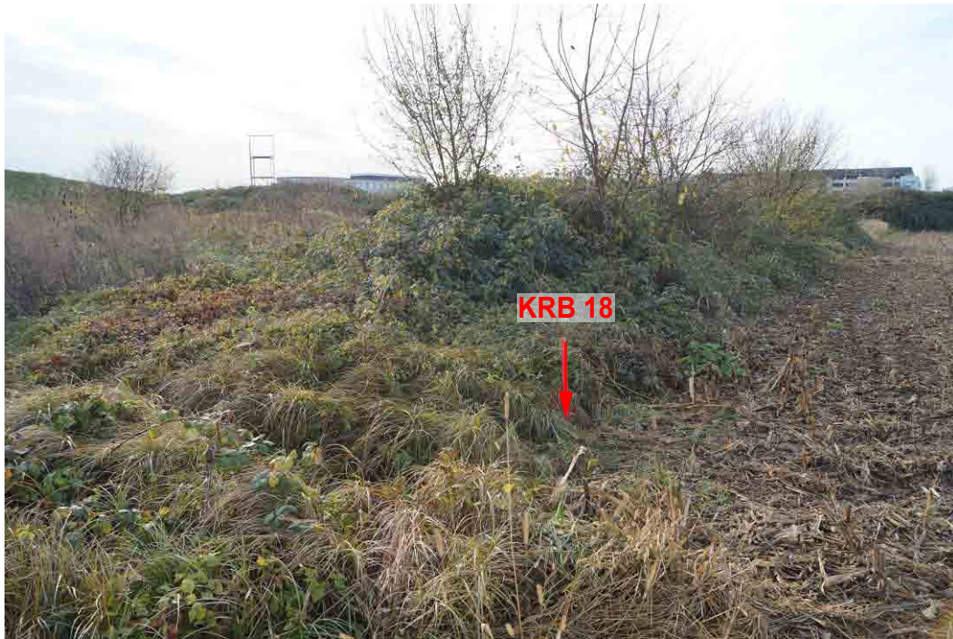
Bild 15: Lage von KRB 18 (Blickrichtung SW) (23.11.2017)