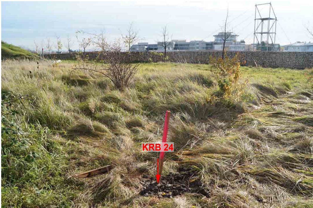
Bild 20: Lage von KRB 24 (Blickrichtung SO) (23.11.2017)