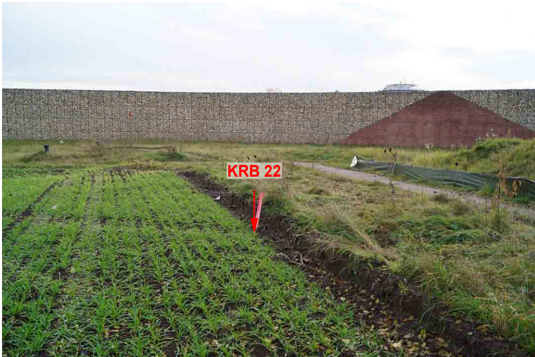
Bild 18: Lage von KRB 22 (Blickrichtung SO) (23.11.2017)