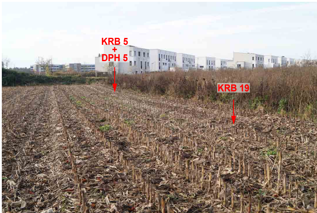
Bild 5: Lage von KRB 5 + DPH 5 und KRB 19 (Blickrichtung W) (23.11.2017)