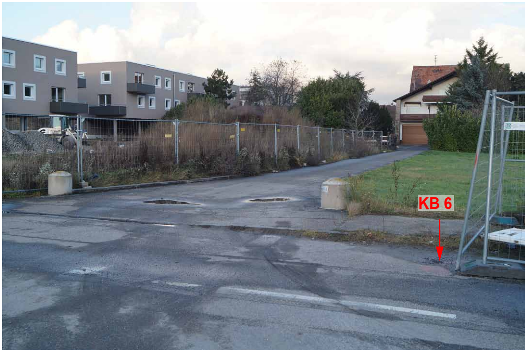
Bild 32: Lage von KB 6 (Blickrichtung N) (29.11.2017)