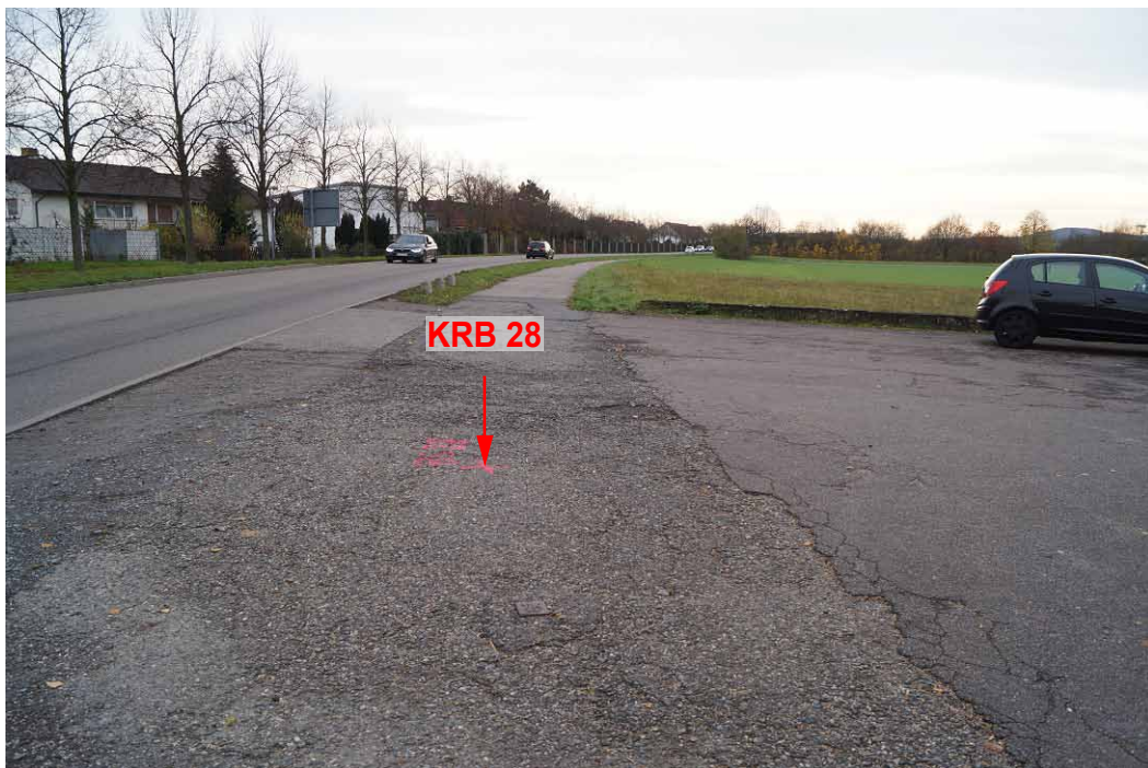
Bild 24: Lage von KRB 28 (Blickrichtung O) (23.11.2017)