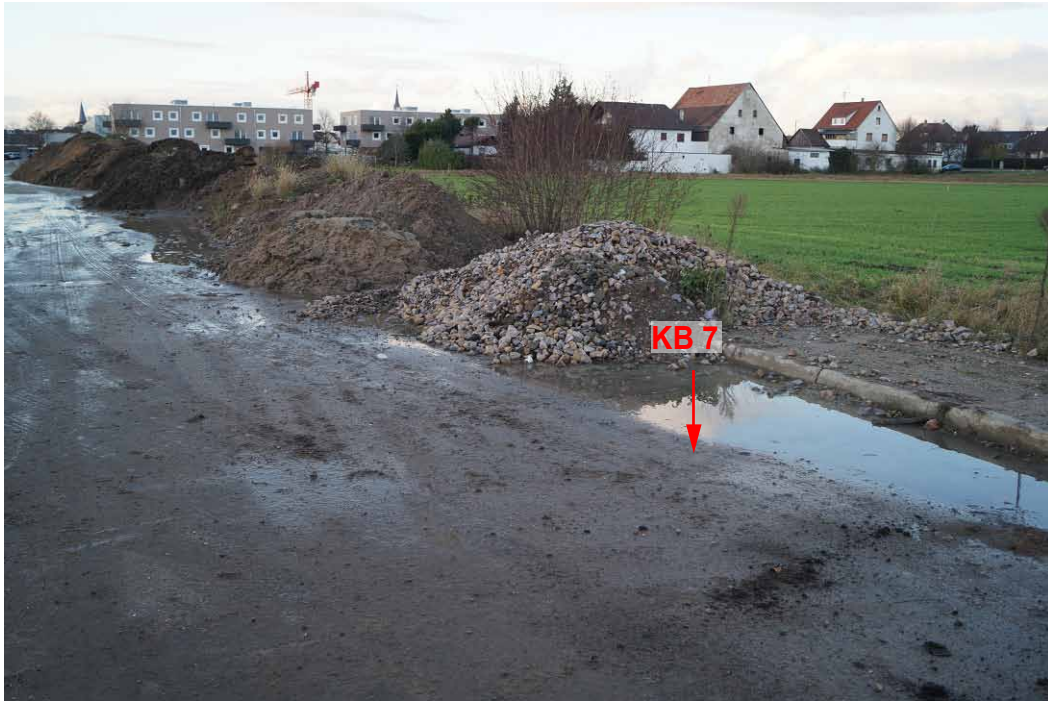
Bild 33: Lage von KB 7 (Blickrichtung N) (29.11.2017)