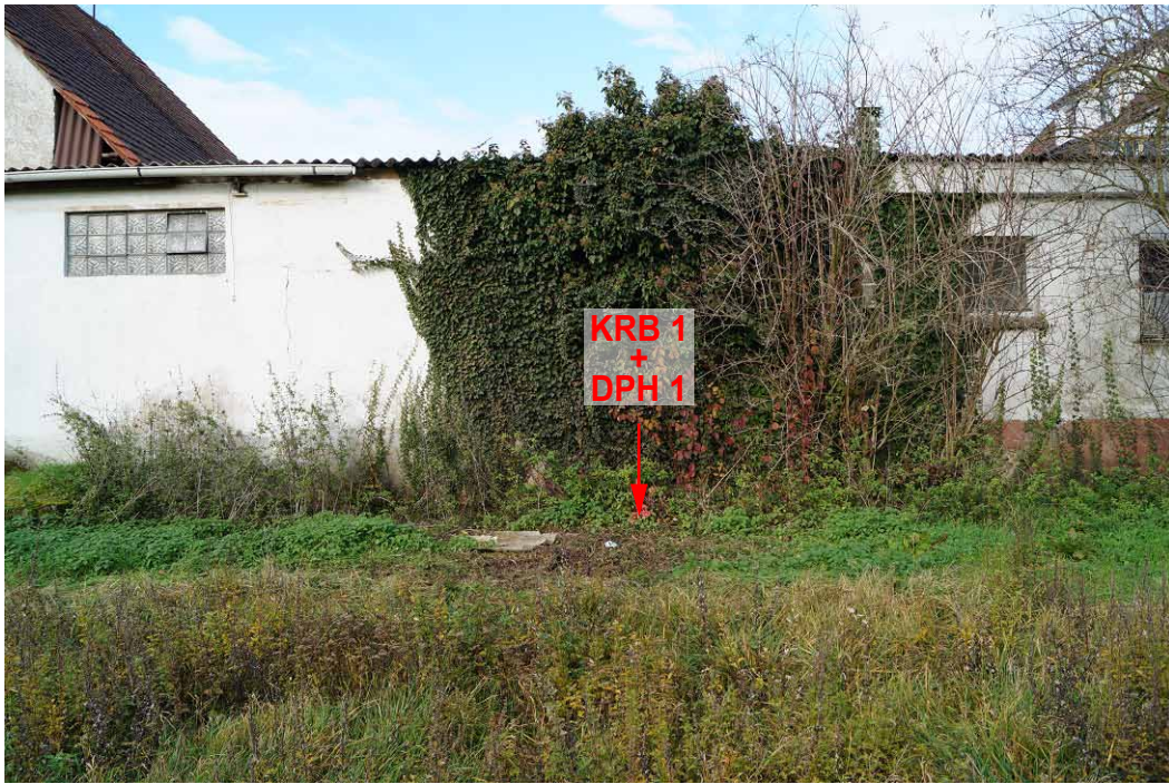
Bild 1: Lage von KRB 1 + DPH 1 (Blickrichtung NW) (23.11.2017)