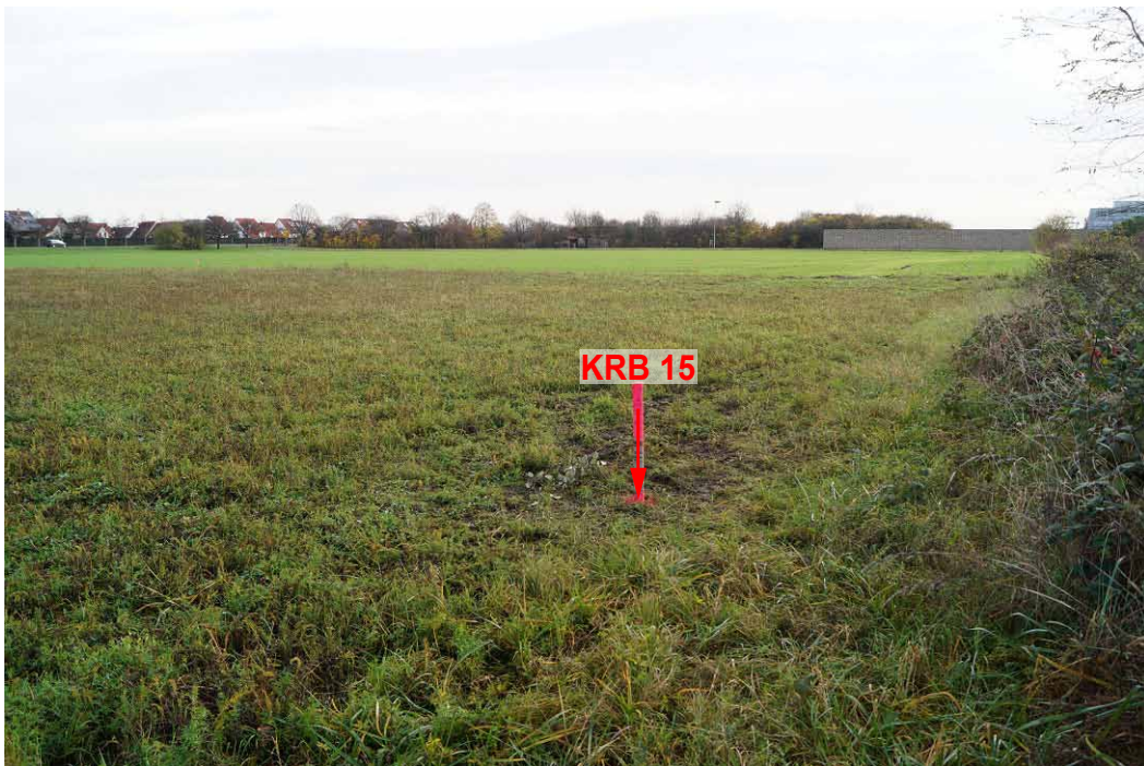
Bild 12: Lage von KRB 15 (Blickrichtung O) (23.11.2017)