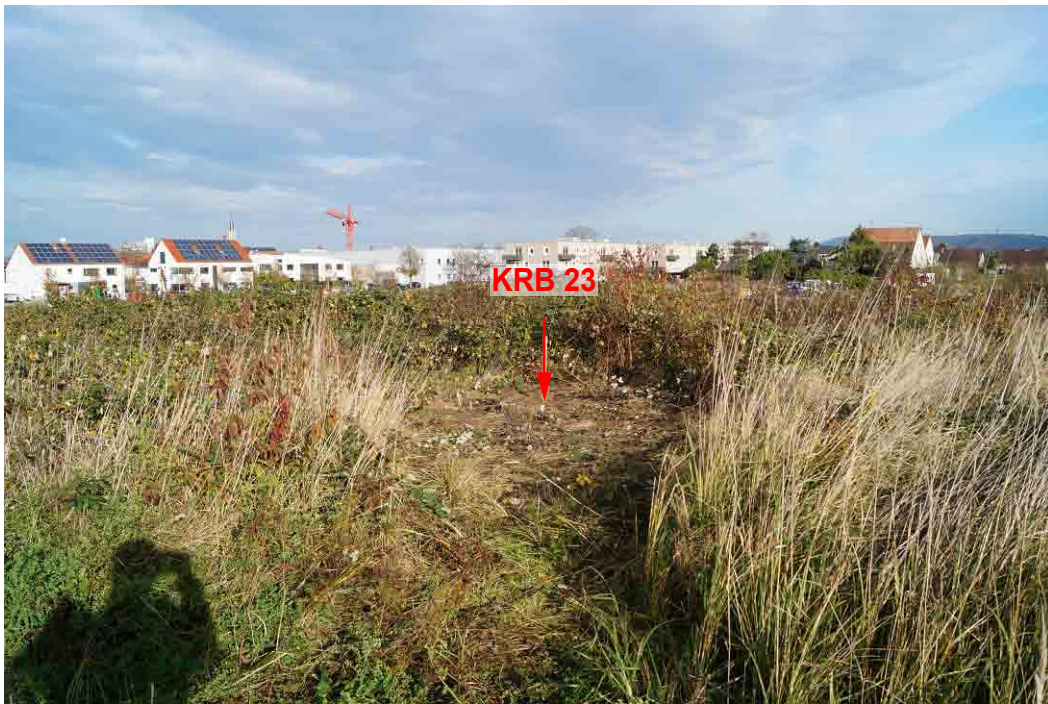
Bild 19: Lage von KRB 23 (Blickrichtung N) (23.11.2017)