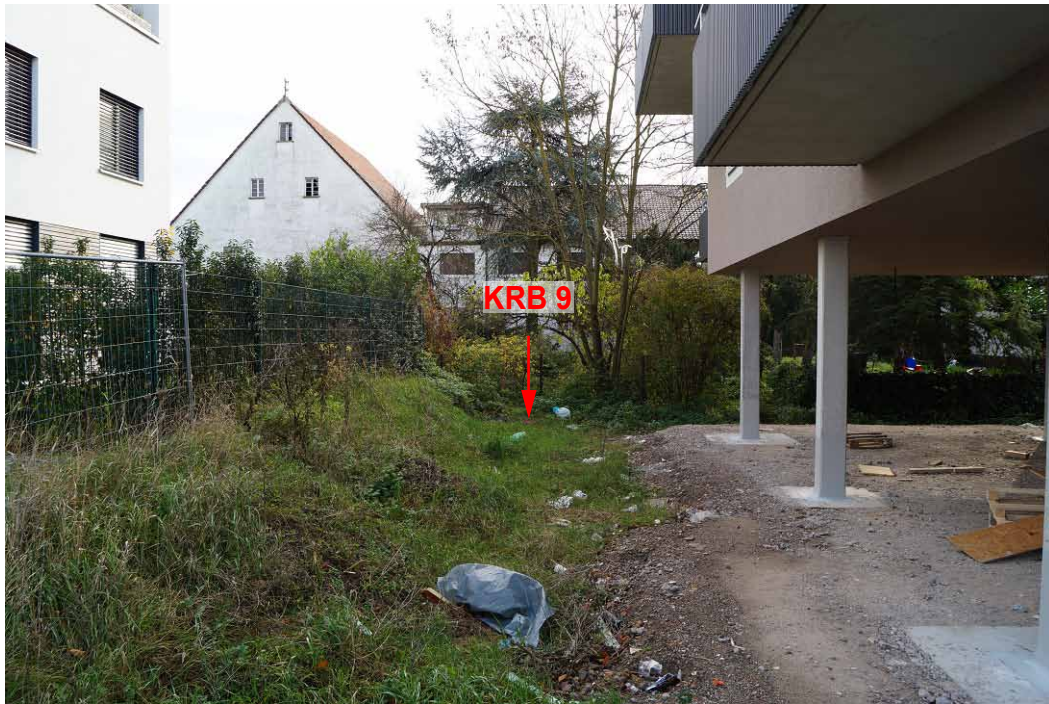
Bild 9: Lage von KRB 9 (Blickrichtung SO) (23.11.2017)