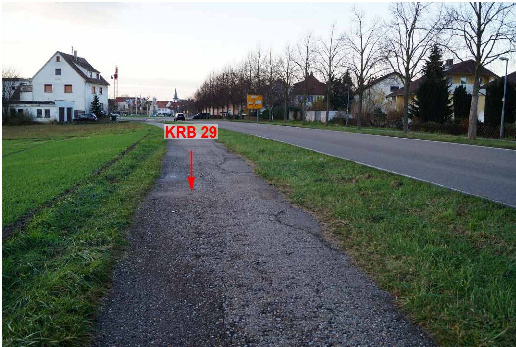
Bild 25: Lage von KRB 29 (Blickrichtung NW) (29.11.2017)