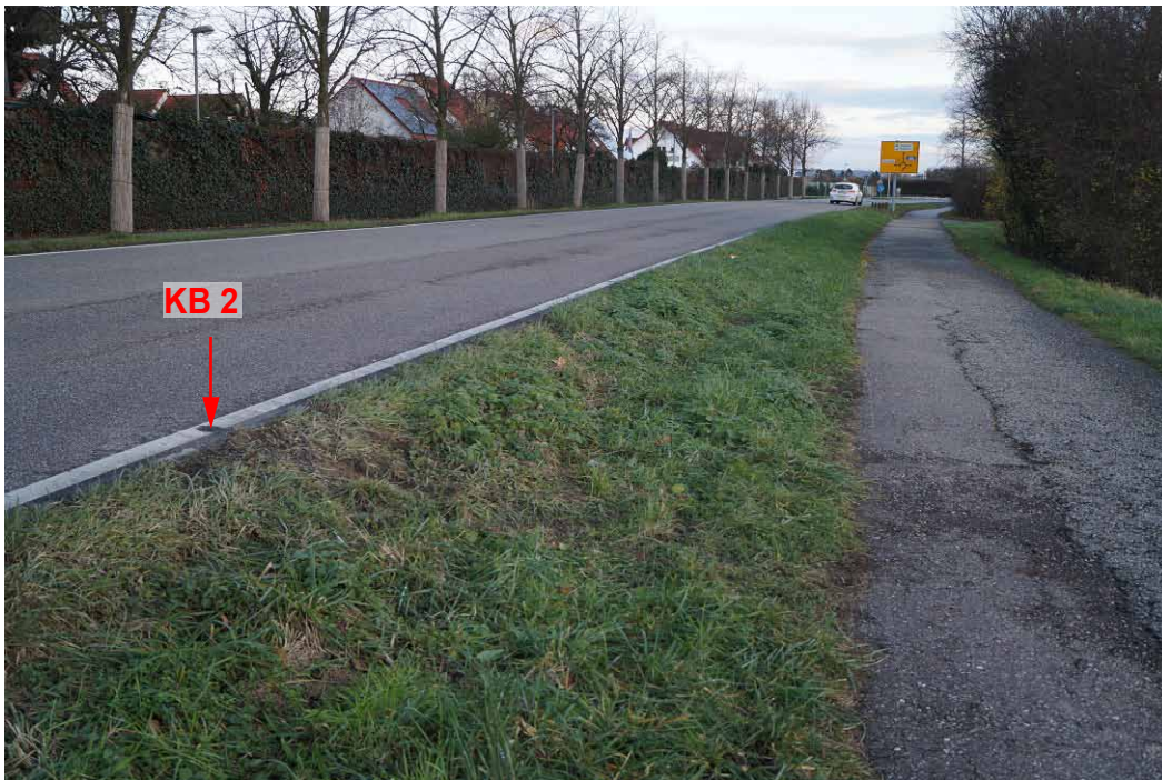
Bild 29: Lage von KB 2 (Blickrichtung SO) (29.11.2017)