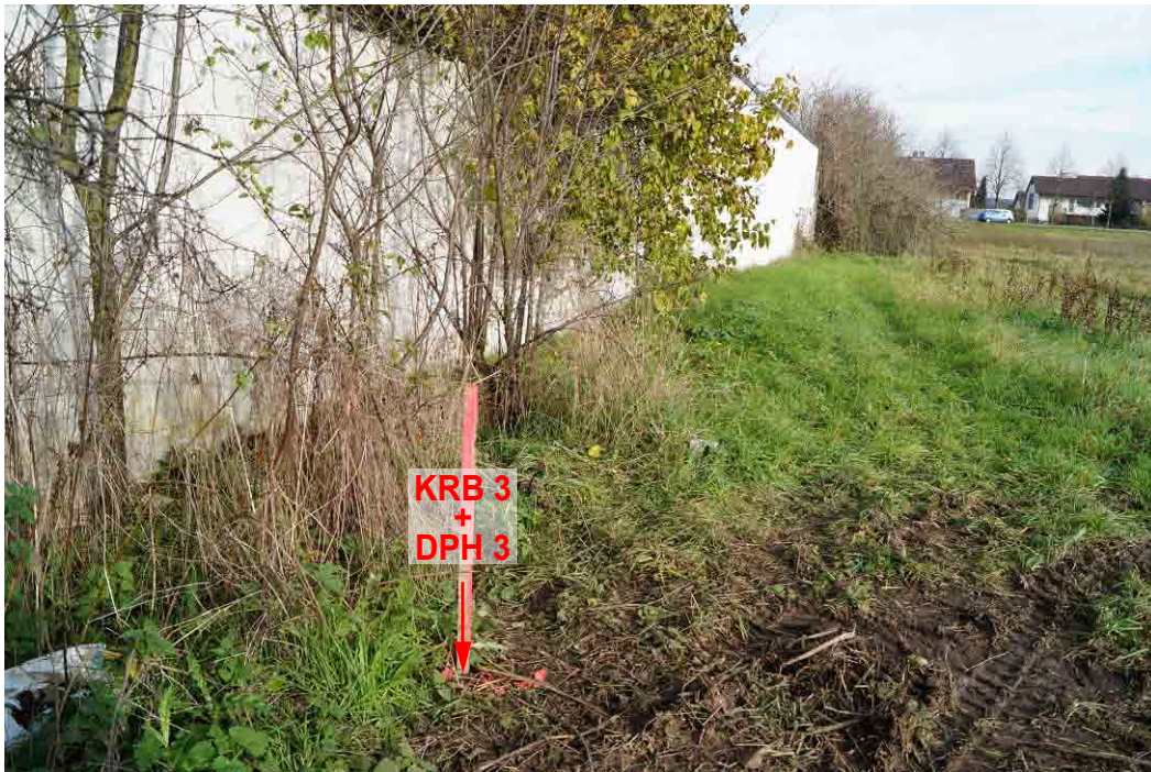
Bild 3: Lage von KRB 3 + DPH 3 (Blickrichtung NO) (23.11.2017)