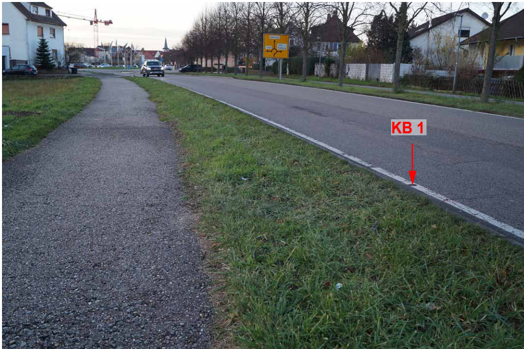
Bild 28: Lage von KB 1 (Blickrichtung NW) (29.11.2017)