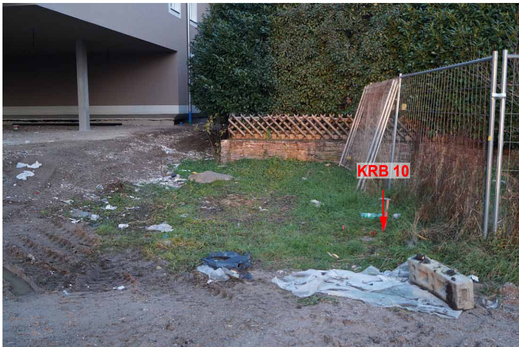
Bild 10: Lage von KRB 10 (Blickrichtung NO) (29.11.2017)