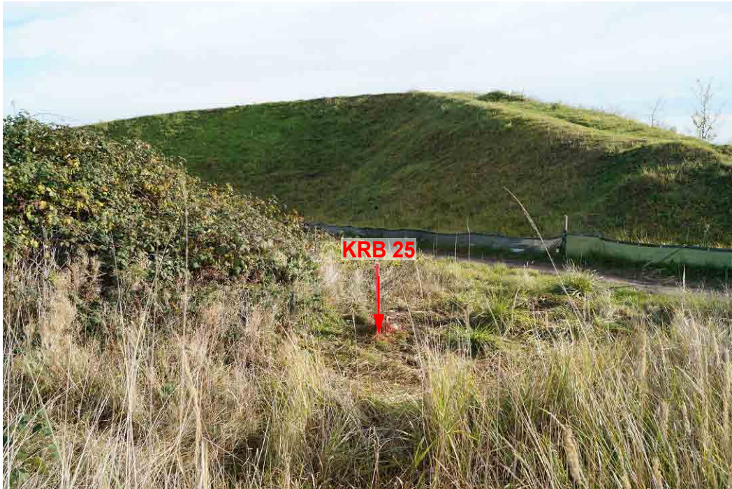
Bild 21: Lage von KRB 25 (Blickrichtung O) (23.11.2017)