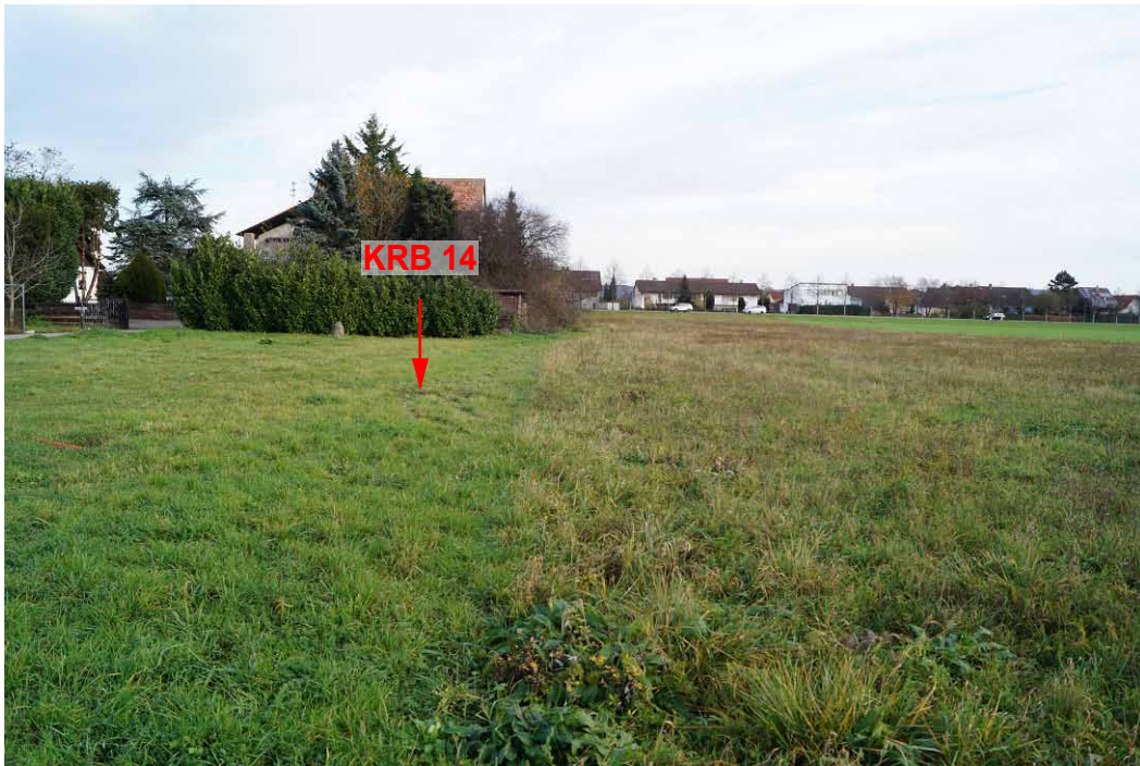
Bild 11: Lage von KRB 14 (Blickrichtung NO) (23.11.2017)