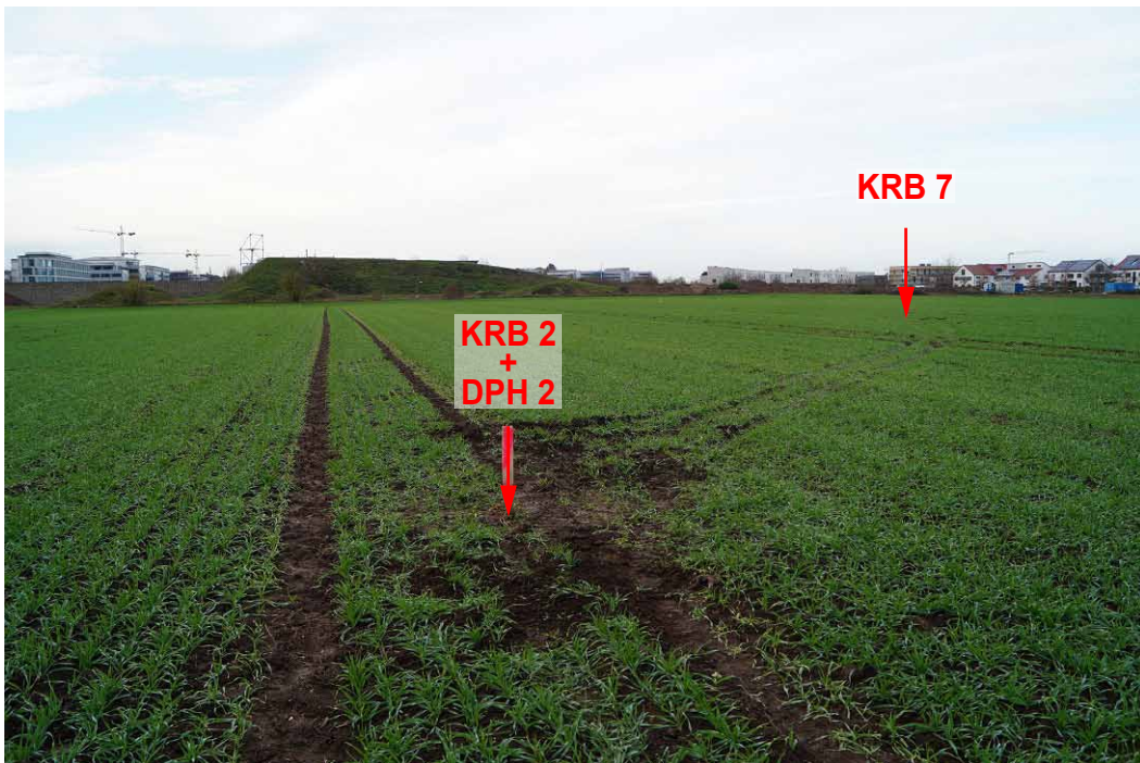
Bild 2: Lage von KRB 2 + DPH 2 mit KRB 7 (Blickrichtung SW) (23.11.2017)