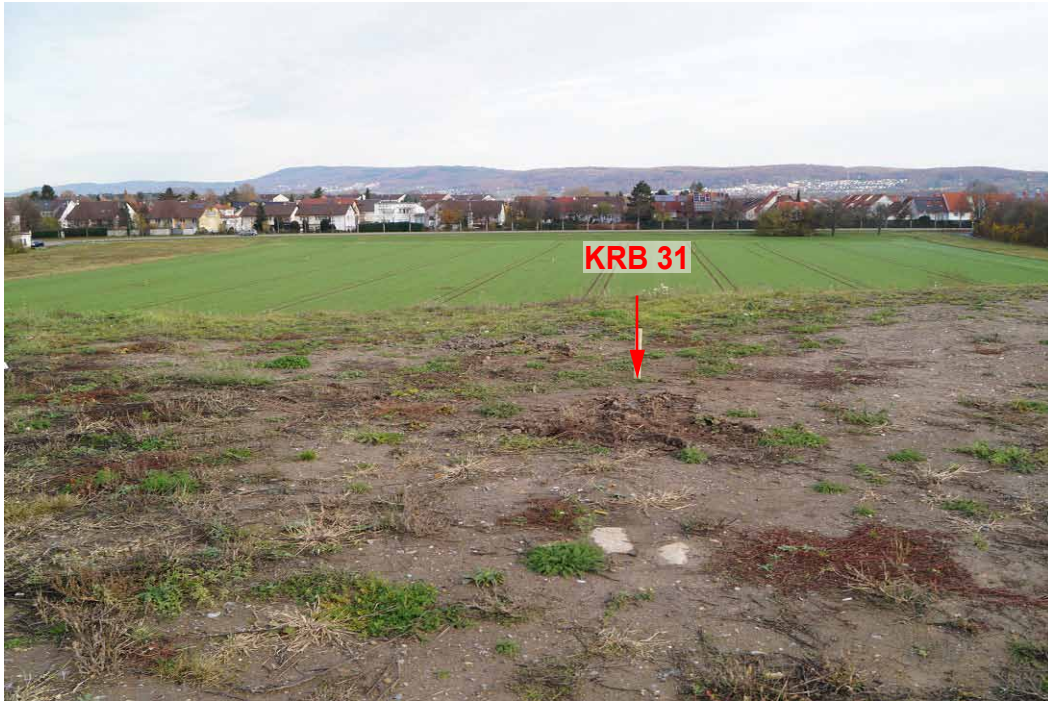
Bild 27: Lage von KRB 31 (Blickrichtung NO) (23.11.2017)