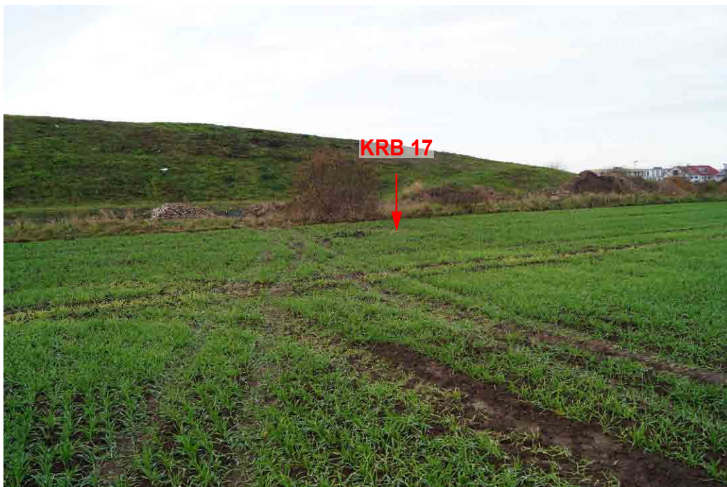
Bild 14: Lage von KRB 17 (Blickrichtung W) (23.11.2017)