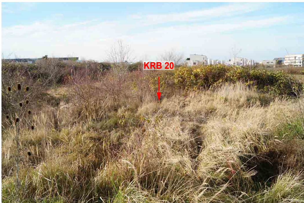
Bild 16: Lage von KRB 20 (Blickrichtung W) (23.11.2017)