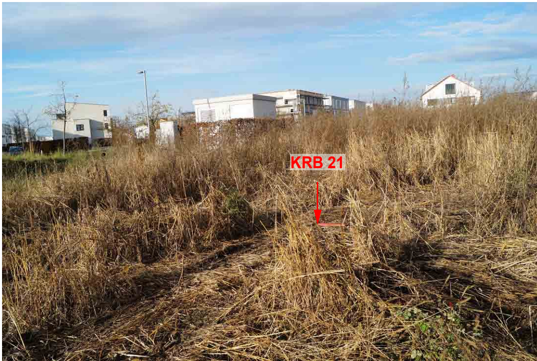
Bild 17: Lage von KRB 21 (Blickrichtung NW) (23.11.2017)