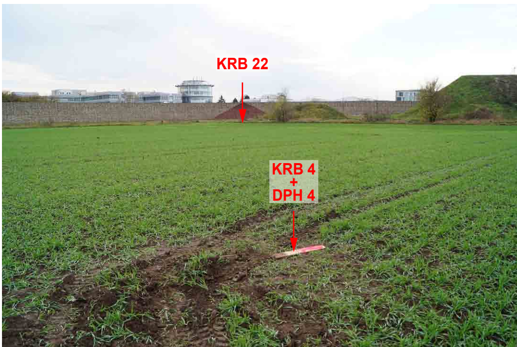
Bild 4: Lage von KRB 4 + DPH 4 mit KRB 22 (Blickrichtung S) (23.11.2017)