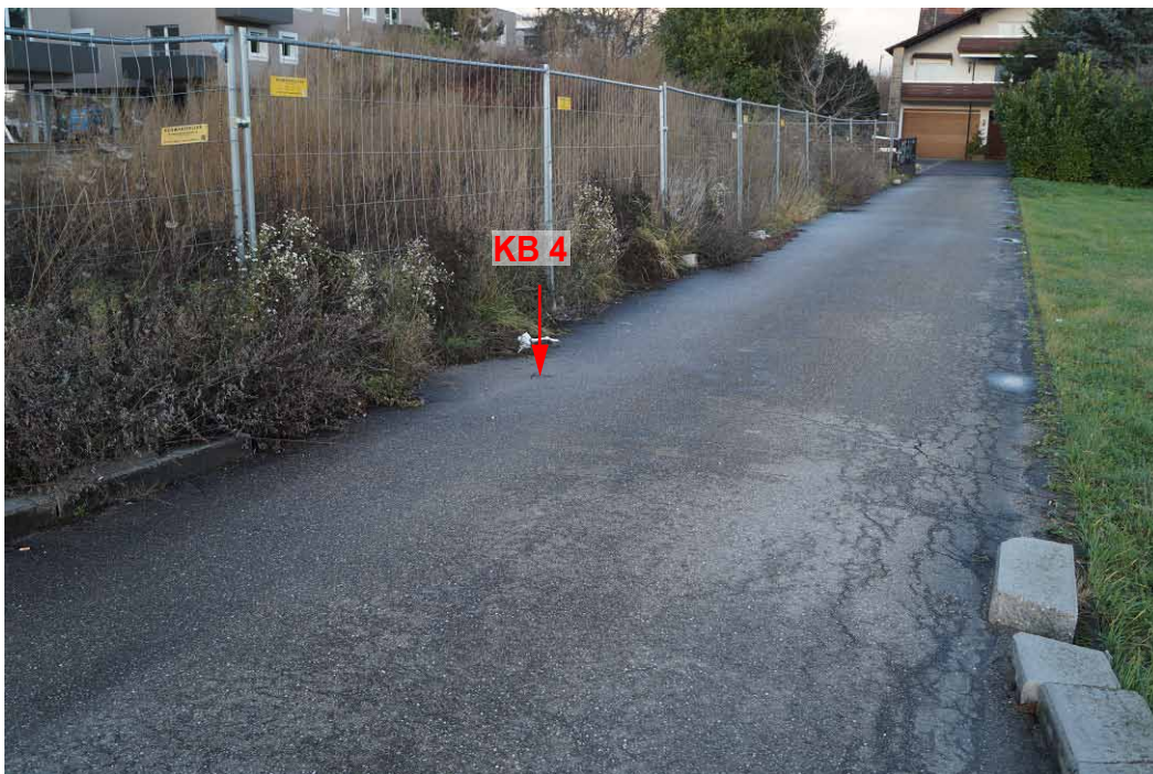
Bild 30: Lage von KB 4 (Blickrichtung N) (29.11.2017)