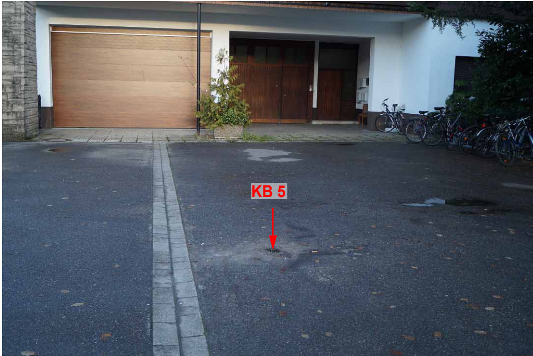
Bild 31: Lage von KB 5 (Blickrichtung NO) (29.11.2017)