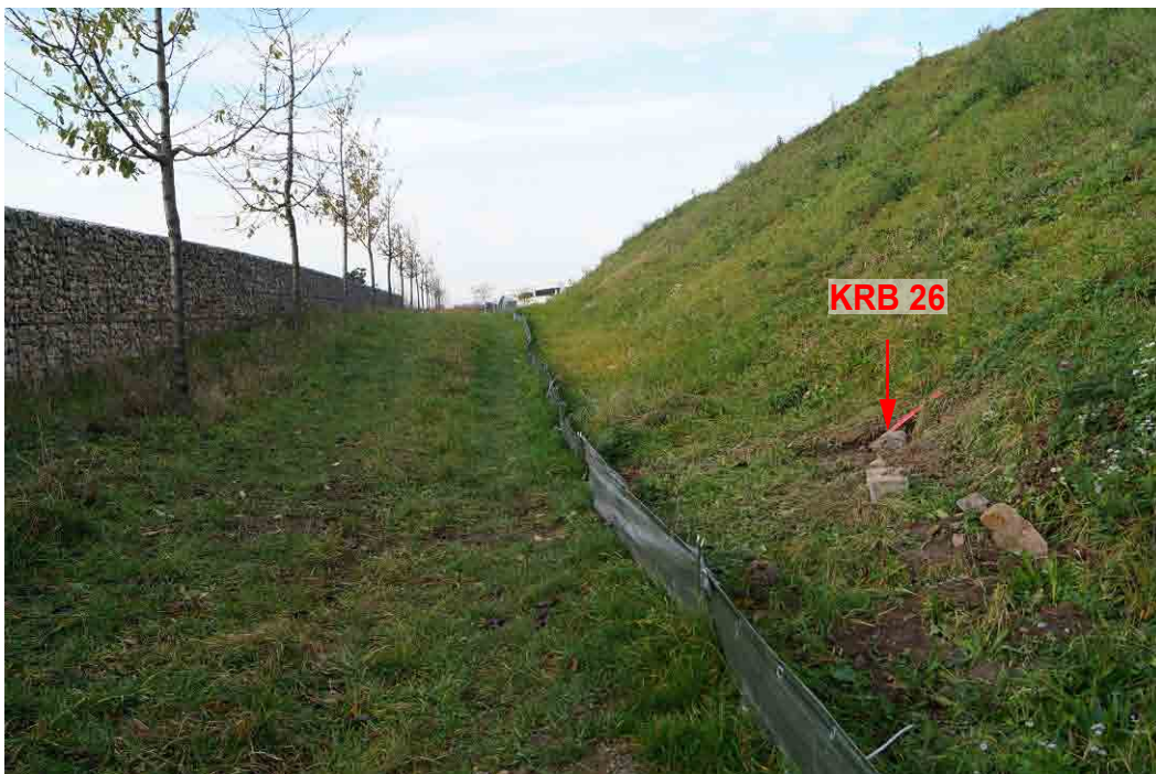
Bild 22: Lage von KRB 26 (Blickrichtung W) (23.11.2017)